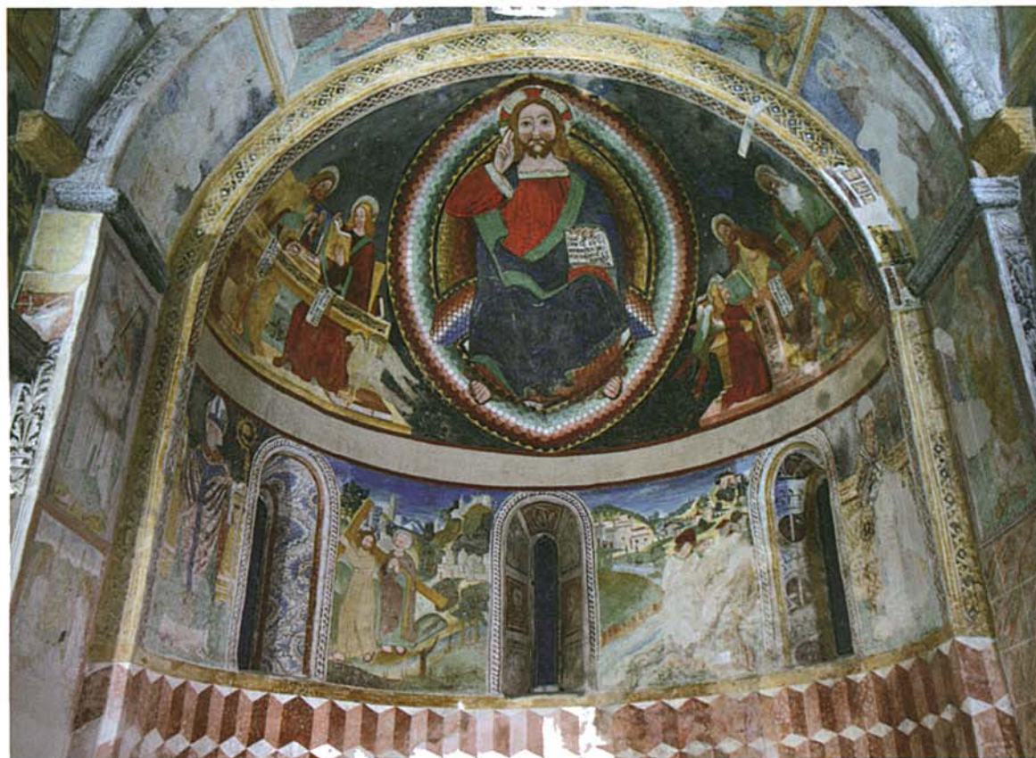
Biasca, Chiesa Parrocchiale dei Ss. Pietro e Paolo. Dettaglio con gli affreschi nel catino absidale

L'obiettivo principale del nuovo impianto era dunque finalizzato a rendere più confortevole la visione dei cicli pittorici, facendone risaltare la resa cromatica dei colori, riducendo al minimo la dispersione luminosa negli spazi della chiesa salvaguardando così il carattere austero e di raccoglimento del luogo. L'essenzialità delle forme architettoniche quasi prive di cornici e capitelli rendeva particolarmente arduo l'inserimento di apparecchi con un impatto visivo ridotto.