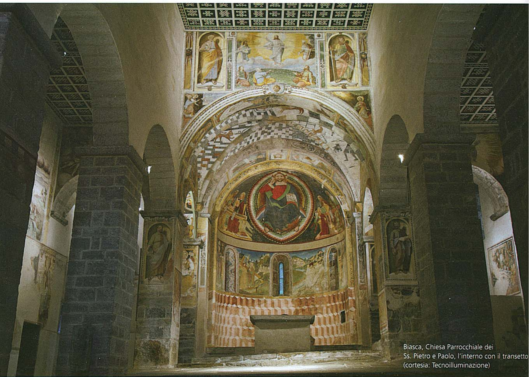
Biasca, Chiesa Parrocchiale dei Ss. Pietro e Paolo, l'interno con il transetto

La chiesa romanica dei Ss. Pietro e Paolo di Biasca è il più importante edificio sacro delle tre valli ambrosiane della Svizzera Italiana